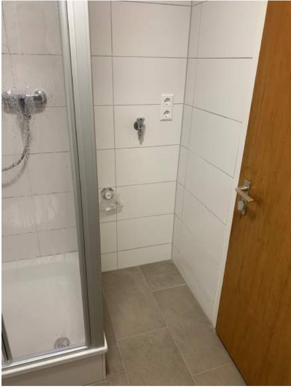
Anschlussmöglichkeit für Waschmaschine und Trockner