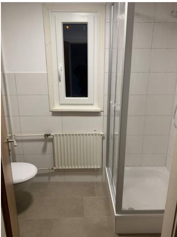
Duschkabine und WC