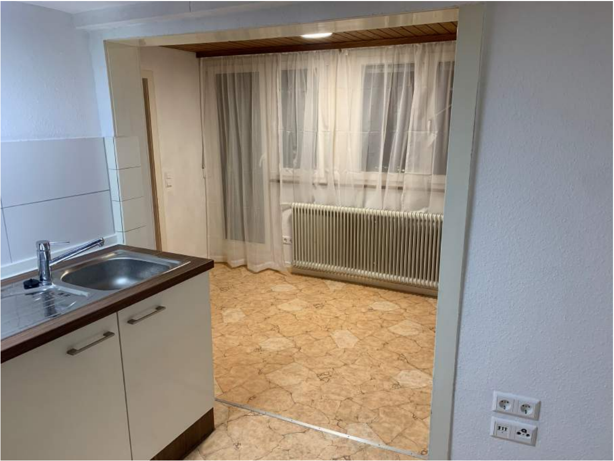
Blick von Wohnraum in Arbeitsbereich