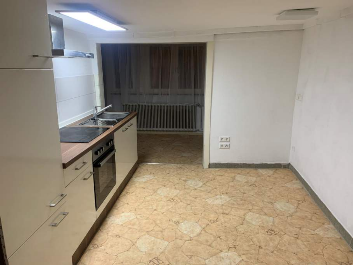
Blick vom Eingang in Wohnraum mit Küche