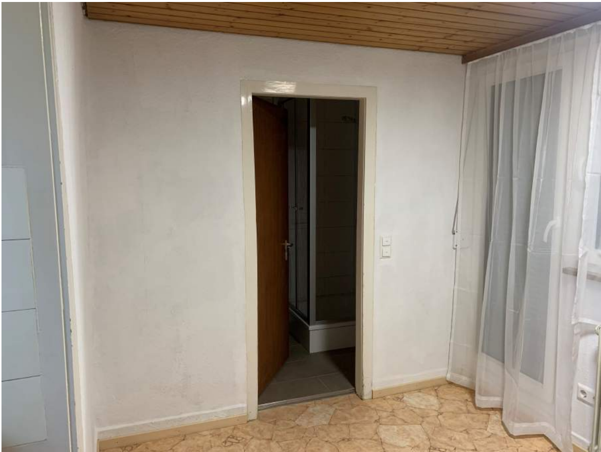
Blick vom Arbeitsbereich in Bad / WC