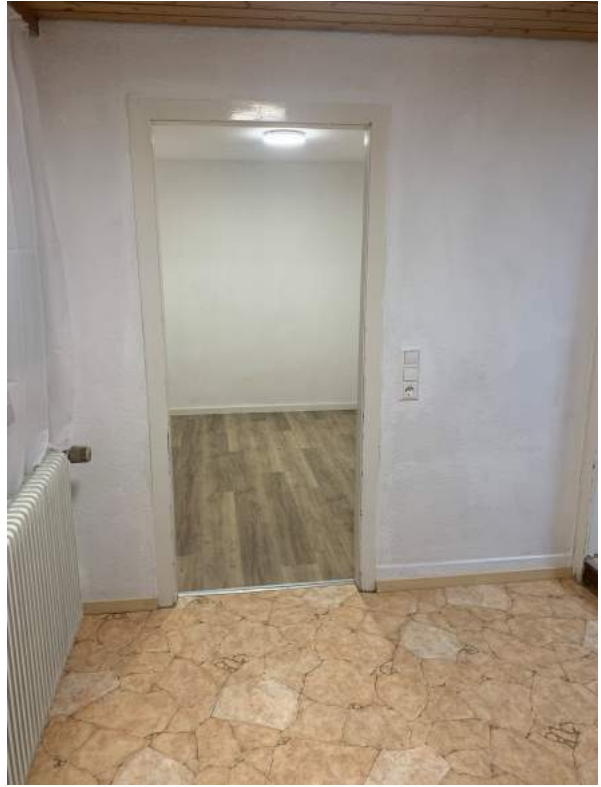
Blick vom Arbeitsbereich ins Schlafzimmer