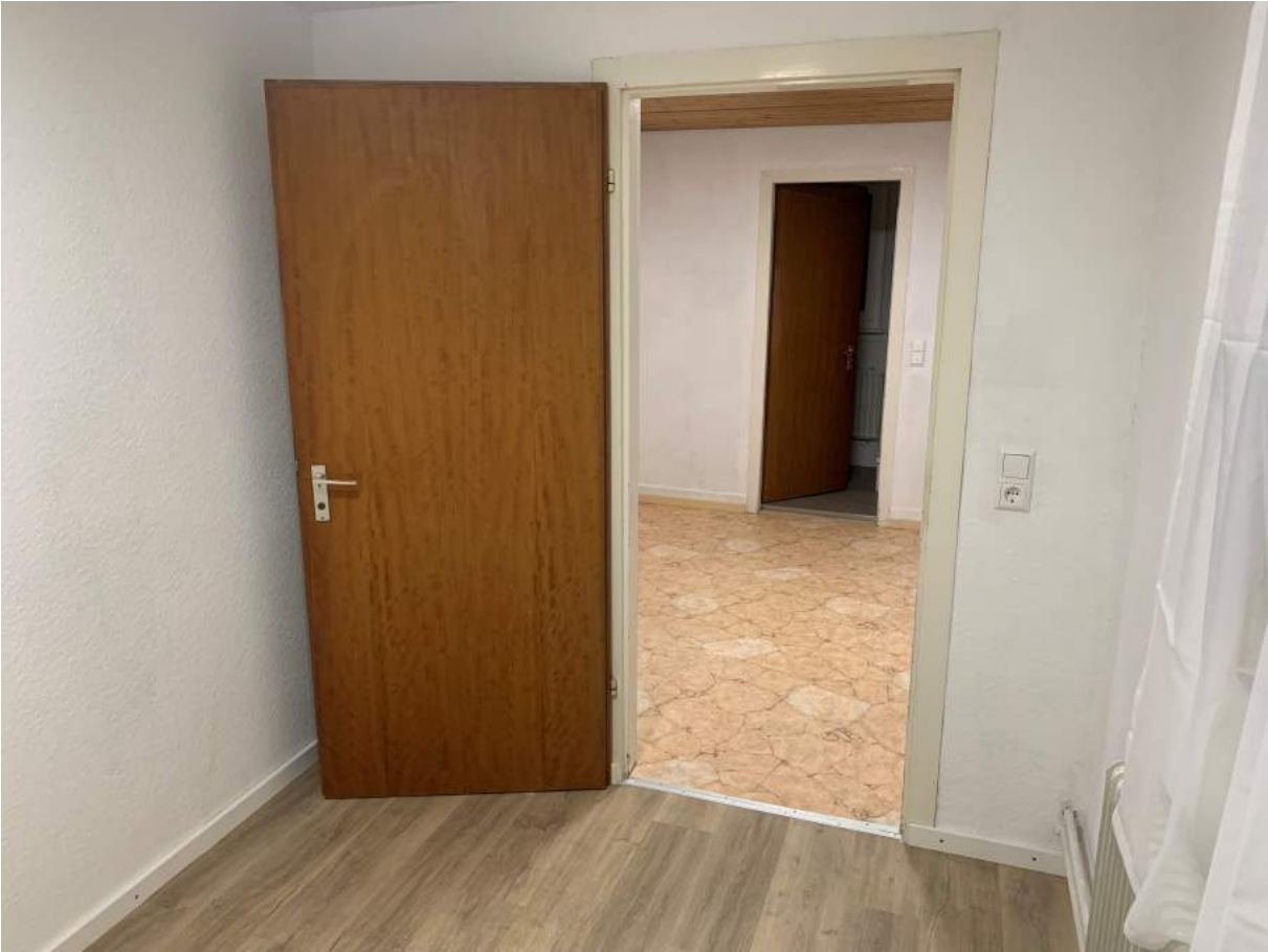
Blick vom Schlafzimmer zum Arbeitsbereich und Bad/WC