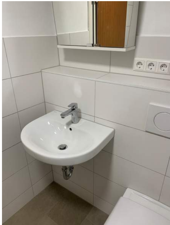
Waschbecken mit Spiegelschrank