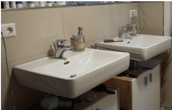
Bad mit Badewanne und Dusche