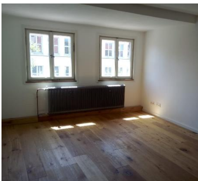
Zimmer mit Holzdielenboden