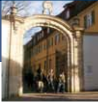
Altbau (KI, KII, KIII), Neckarsteige 6-10, Nürtingen