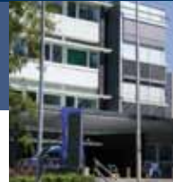
Parkstraße 4 (PA4), Geislingen