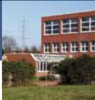
Neubau, (KIV), Schelmenwasen 4-8, Nürtingen