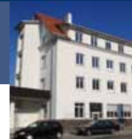
Bahnhofstraße 37 (BA37), Geislingen