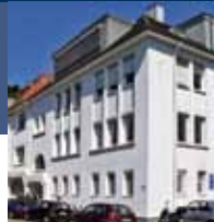
Hauber-Areal (KV), Sigmaringer Str. 14, Nürtingen