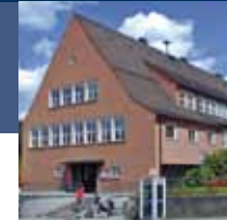
Bahnhofstraße 62 (BA62), Geislingen