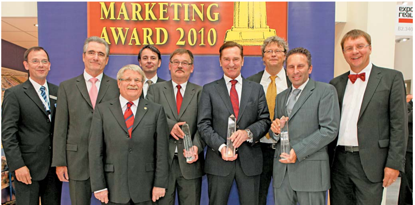
Preisträger des Immobilien-Marketing-Awards 2010, Laudatoren und Vertreter der Sponsoren nach der Preisverleihung auf der Expo Real.