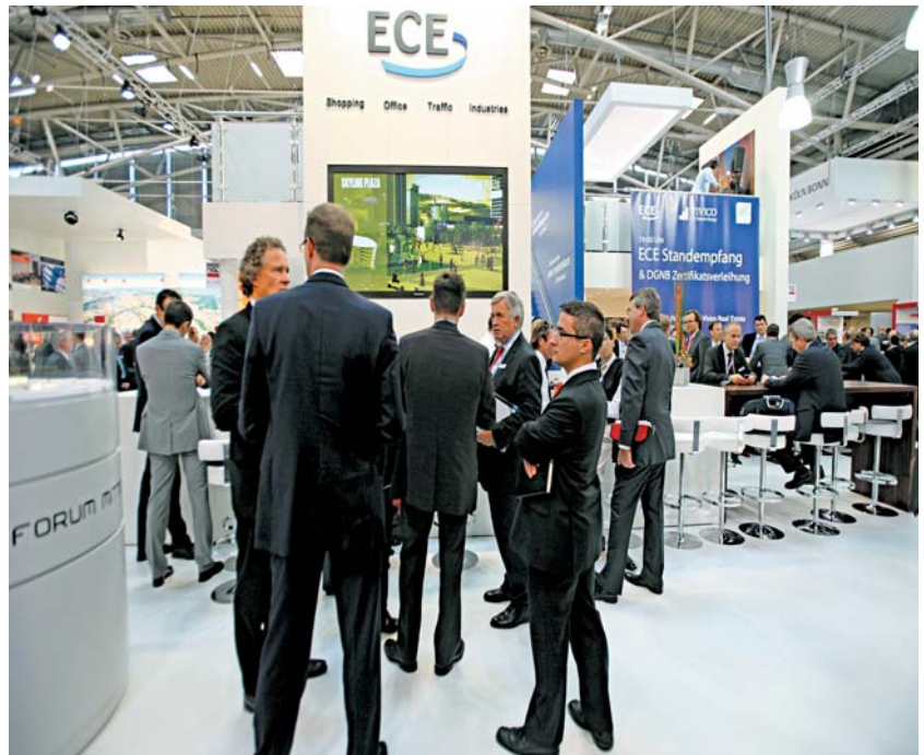
Der Stand der ECE Projektmanagement war der Ort der Preisverleihung. Das Unternehmen war zusammen mit Immobilien Scout 24 Hauptsponsor des Immobilien-Marketing-Awards 2010.