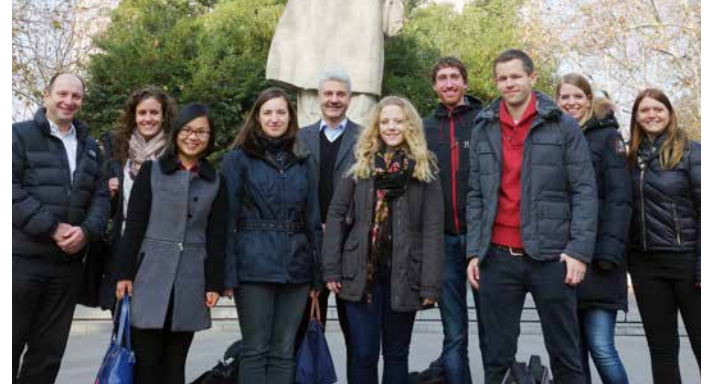
Campus der Tongji University