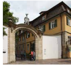
Campus Innenstadt

Die Hochschule für Wirtschaft und Umwelt Nürtingen-Geislingen (HfWU) ist eine von 28 Hochschulen für angewandte Wissenschaften in Baden-Württemberg, die sich neben Universitäten und Dualen Hochschulen ein eigenes Profil als akademische Bildungseinrichtung erworben haben.