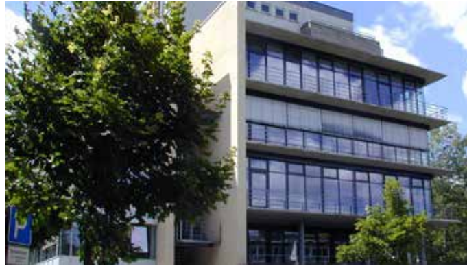
Hochschulgebäude in der Parkstraße

Der Studiengang Immobilienmanagement ist im Rahmen der Systemakkreditierung durch AQAS akkreditiert und berechtigt, das Siegel des Akkreditierungsrates zu führen.