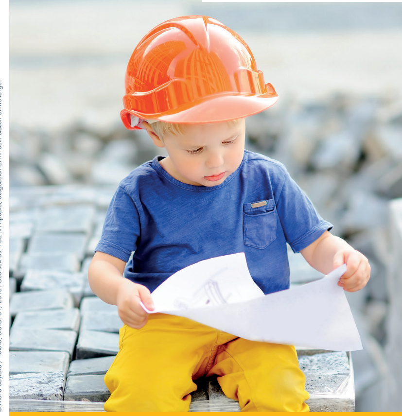
Stand: 01/2018, Gedruckt auf 100% Altpapier, ausgezeichnet mit dem blauen Umweltsiegel.