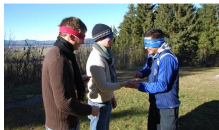
Teamtraining im Allgäu