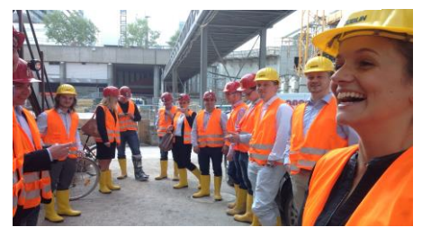
Exkursion Stuttgart 21