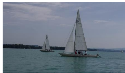
Segeln am Bodensee