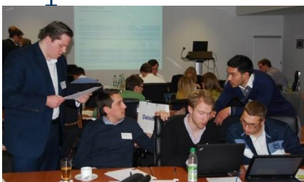
Fallstudie bei Deloitte/München