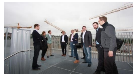
Exkursion mit Drees & Sommer und Immoraum/Stuttgart