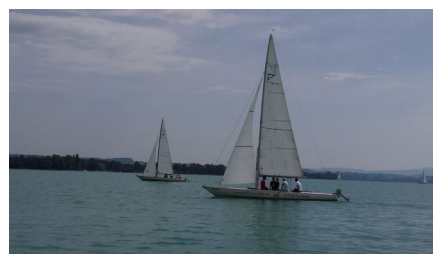
Segeln am Bodensee