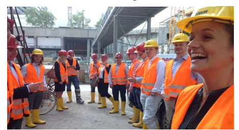
Exkursion Stuttgart 21