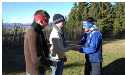
Teamtraining im Allgäu