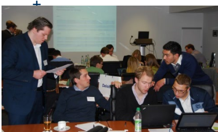
Fallstudie bei Deloitte/München