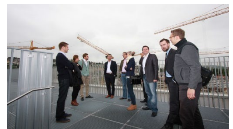
Exkursion mit Drees & Sommer und Immoraum/Stuttgart