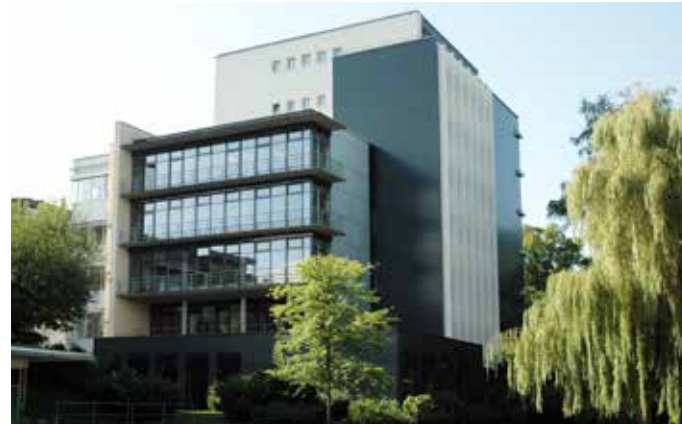
Hochschulgebäude in der Parkstraße

Die Hochschule für Wirtschaft und Umwelt Nürtingen-Geislingen (HfWU) ist eine von 28 Hochschulen für Angewandte Wissenschaften in Baden-Württemberg, die sich neben den Universitäten ein eigenes Profil als akademische Bildungseinrichtung erworben hat. Praxisbezogene Lehre und anwendungsorientierte Forschung bestimmen die Studienkonzeption. Der Bachelorstudiengang Gesundheits- und Tourismusmanagement am Standort Geislingen bietet kurze Studienzeiten und kleine Semestergruppen. Er ist akkreditiert im Rahmen der Systemakkreditierung durch AQAS. In vielen Rankings (Stern, Manager Magazin, Stiftung Warentest, Wirtschaftswoche, Junge Karriere/Handelsblatt) platzierte sich die HfWU unter den Besten der wirtschaftswissenschaftlichen Hochschulen im Bundesgebiet.