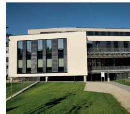
HfWU, C110 Campus Innenstadt, Sigmaringer Str. 25