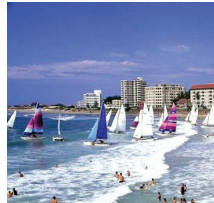
South Africa: Hobie Beach

Die Studierenden verbringen das dritte und vierte Studiensemester bei HfWU-Partnern im Ausland. Wir haben Partnerhochschulen auf allen Kontinenten, u.a. in Australien, Japan, Kanada, Korea, Mexiko, Südafrika und USA.