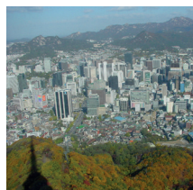
Korea: Seoul Tower

Einige Partneruniversitäten verlangen für das Auslandsstudium Studiengebühren und in einigen Ländern muss zudem mit höheren Lebenshaltungskosten gerechnet werden.