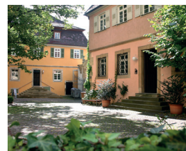
HfWU, C11-7 Campus Innenstadt, Neckarsteige 6-10

Die Hochschule für Wirtschaft und Umwelt Nürtingen-Geislingen (HfWU) ist eine von 28 Hochschulen für Angewandte Wissenschaften in Baden-Württemberg. Sie hat sich neben den Universitäten ein praxisbezogenes Profil als akademische Bildungseinrichtung erworben. Praxisbezogene Lehre, anwendungsorientierte Forschung und internationale Ausrichtung bestimmen die Studienkonzeption.